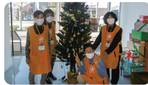
クリスマスツリー飾りつけ