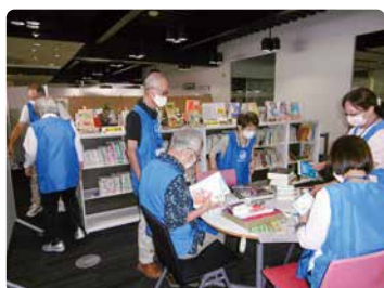
2階福祉図書コーナー整理